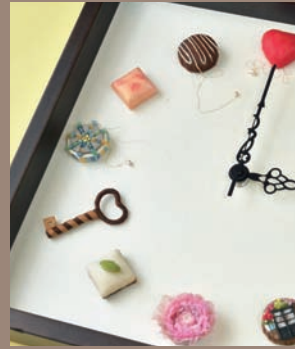
作品「ショコラ時計」