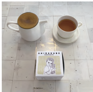
HOT TEA | SHIRAKABE