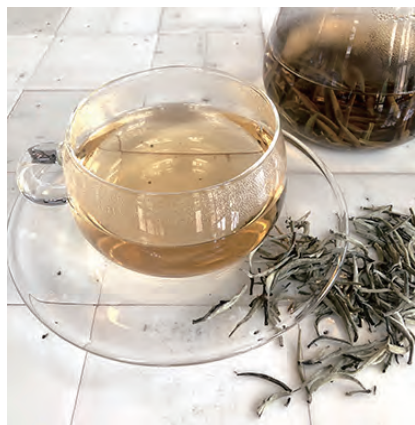
HOT TEA | WHITE TEA

たっぷりのドライローズと、白桃の みずみずしい香りがブレンドされた 華やかなフレーバーティーです。