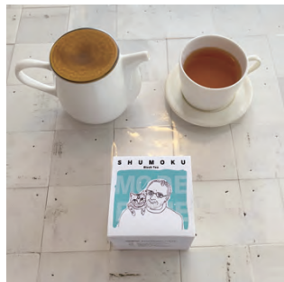
HOT TEA | SHUMOKU

紅茶はスリランカの限られた地域で栽培されている希少な茶葉のみを使用した、ムレスナ社のブレンドを使用しております。