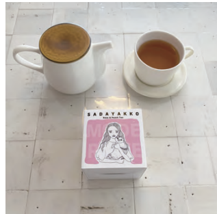
HOT TEA | SADAYAKKO