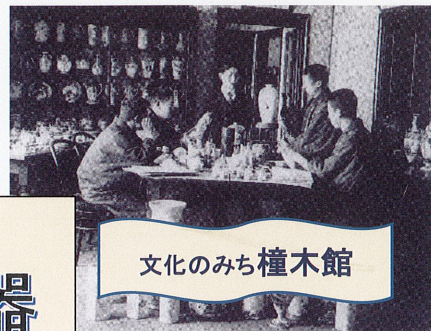
文化のみち榎木館