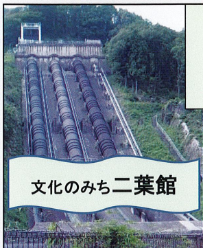
文化のみち二葉館