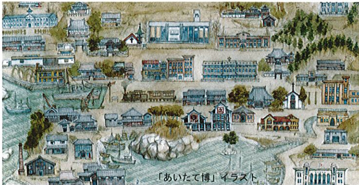
「あいたて博」イラスト