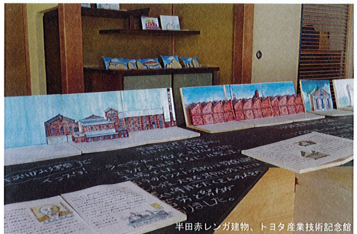
半田赤レンガ建物、トヨタ産業技術記念館

街かどにたたずむ懐かしくて素敵なお建物を、手のひらサイズの折り紙建築でぜひお楽しみください。