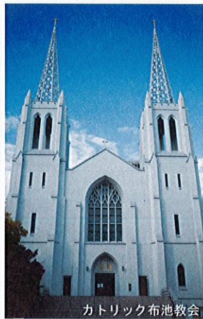
カトリック布池教会