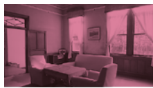
旧豊田佐助邸(左:洋間、右:和室)